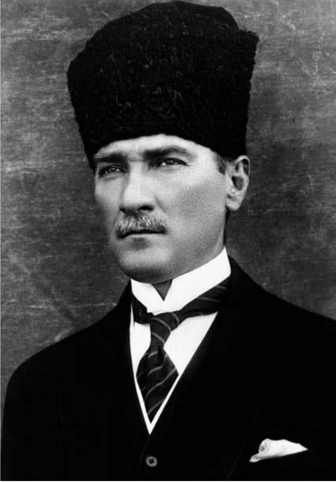
Mustafa Kemal ATATÜRK